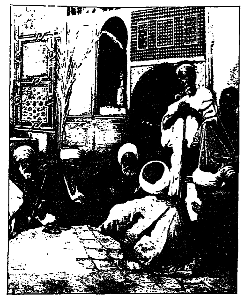
جلسة عربية للفنان لودفيغ دوبوش (١٨٨١)

ما هي الاهداف التي تسعى اليها في هذا المجال ؟ الاهداف التي تسعى اليها في هذا المجال هي تعليم الناس الموسيقى ، وتزويدهم بالمعلومات الصحيحة ، وتزويدهم بالفرص المناسبة ، وتزويدهم بالفرص المناسبة .